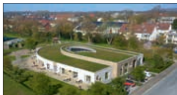
Am PC ist es schon fertig.