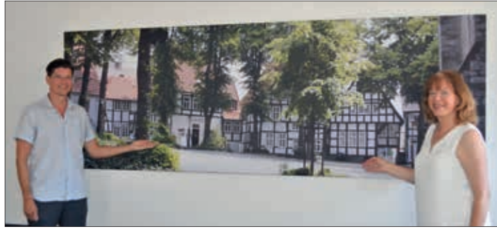
Auch der Kirchplatz, auf den Abteilungsleiter Eckhard Hoffmann und Bürgermeisterin Anne Rodenbrock-Wesselmann hier zeigen, gehört zu den Bereichen, die umgestaltet werden sollen

Ab sofort bis zum 30. September 2020 läuft eine Online-Umfrage zur Umgestaltung der Straßen und Plätze der Haller Innenstadt. Die Stadt lädt alle Bürger*innen ein, sich an der Umfrage zu beteiligen, die nicht mehr als 5 bis 10 Minuten Zeit in Anspruch nimmt. Für Interessierte ohne Internetzugang liegen in der Zentrale des Rathauses-1 Fragebögen in Papierform aus. Bereits im Vorfeld konnten Haller Bürger*innen im Rahmen verschiedener Veranstaltungen Ideen für die Entwicklung der Stadt vorschlagen. Das Bürgerforum, die fünf Dorfspaziergänge und der Innenstadtpaziergang boten die