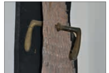
Ein Stück des Eisernen Vorhangs, der sich öffnet

lässt und die Dinge aufnimmt, die die Werke zeigen, bringt diese in Bewegung – an ihrem festen Platz im Museum, verhaftet in Verbindung mit Holz oder Blei, schwere Stoffen, die durch ihre Metamorphose ganz leicht werden. Da werden Kleiderbügel zu Kranichen, ein Totempfahl zu einem Krokodil, Eisenstäbe zu Afrikanern und ein Stück des Eisernen Vorhangs öffnet sich durch zwei Türklinken. Auch zwei Schuhsohlen, fixiert auf einer Holzplatte, kommen durch ihre Anordnung in Bewegung und signalisieren „Liberty“. Ausgestanztes Metall arrangiert sich zum homogenen Teutoburger Wald und doch ist jeder Baum durch die Patina ganz individuell. Der Besucher begegnet Engeln, Sonnen, Elefanten, Blumen und all dem, was er selbst in den Werken sieht – Metamorphosen in den eigenen Gedanken. In Halle gäbe es so viele Künstler, sagt Ursula Blaschke. „Dafür will ich das Haller Herz höher schlagen