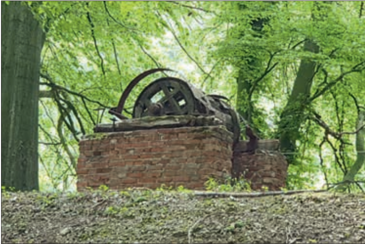
Alte Maschinen vom Bergbau und kleine Schätze mitten im Teutoburger-Wald, zwischen Kaffeemühle und Hotel Grünwalde

Auch in 2020 ging es mit dem CDU Stadtverband wieder im Rahmen der Ferienspiele auf Erkundungstour „Rund um den Schützenberg“. Gestartet wurde in der Nähe des Katharinenstollens am Berghagen. Anders als die Jahre zuvor mußte der Coronasituation geschuldet in kleinen Gruppen mit max. 10. Personen gestartet werden. Entdeckt wurden alte Maschinen vom Bergbau und kleine Schätze. Nach der Fernbesichtigung des weißen Wolfes vom Schützenberg ging es über eine kleine Kletteraktion am Seil auf den Knüll. Beim Abstieg ging es vorbei an den Waldbegräbnissen zu einem