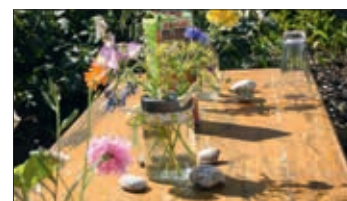
Sommerliche Blumendekoration, von Bewohnern des Marienheims liebevoll gestaltet.

eine Gruppe selber gepflückt hatte, liebevoll dekoriert. Eine leckere Pflirsichbowle, mit und ohne Alkohol, wurde ebenfalls gemeinsam mit den Bewohnern angesetzt - alle ließen sich das kühle Getränk gut schmecken. Später wurde dann noch der Grill angeworfen und bei Salaten und leckeren Grillwürstchen klang der Nachmittag aus. Es war nur ein kleines Fest, zu dem nur die Bewohner selber eingeladen wurden. Aber nach den langen Kontaktbeschränkungen, die Menschen in Einrichtungen besonders hart getroffen haben, war dies einmal wieder ein willkommener Anlass, sich auf Abstand wenigstens zu sehen und einen heiteren Nachmittag, abseits der sonstigen Tagesroutine, bei tollem Wetter zu genießen. –sge-