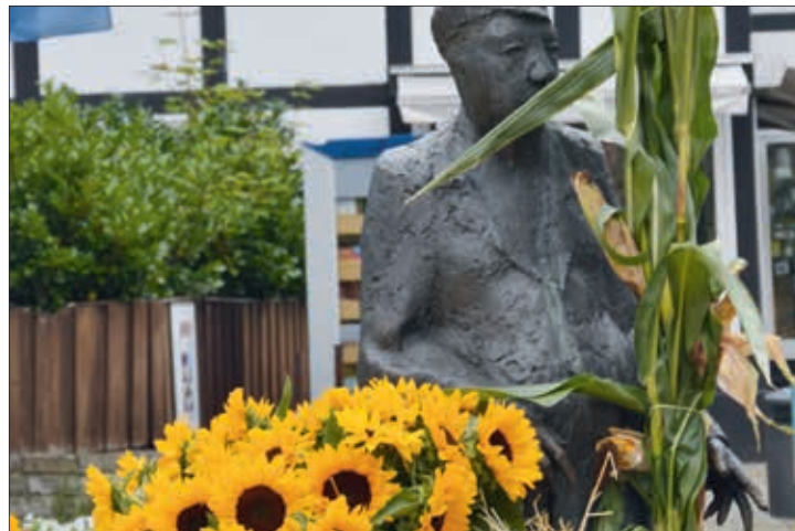
Die Innenstadt wird wieder liebevoll mit Strohballen, Sonnenblumen und Maiskolben dekoriert sein

In diesem Jahr ist nichts, wie es einmal war. Auch der Haller Herbst ist von der Corona-Pandemie betroffen. So musste die Haller Interessen- und Werbegemeinschaft schweren Herzens den beliebten Herbstflohmarkt am ersten Samstag im September – wie auch schon im Mai - absagen. „Der Haller Herbst allerdings wird stattfinden“, ist sich der HIW-Vorstand sicher und steht schon seit einigen Wochen in der Vorbereitung dessen, was unter Corona-Vorschriften möglich ist.