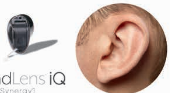
SoundLens iQ [Synergy]