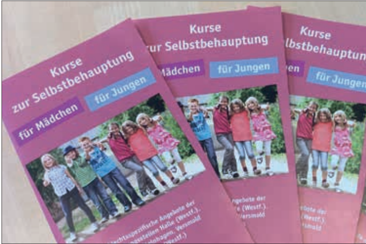
Wochenkurse der Gleichstellungsstelle der Stadt Halle Westfalen im September

Am 26. und 27. September 2020 bietet die Gleichstellungsstelle der Stadt Halle (Westf.) wieder einen Wochenendkurs Selbstverteidigung und Selbstbehauptung für Mädchen im Grundschulalter an. Ziel des Kurses ist es, das Selbstbewusstsein der Mädchen zu stärken und sie besser davor zu schützen, Opfer von Übergriffen zu werden. So können die Teilnehmerinnen lernen, unangenehme und gefährliche Situationen frühzeitig zu erkennen und zu beenden und sich im Ernstfall besser zu wehren. Das Trainingsprogramm ist speziell für Mädchen entwickelt. Gearbeitet wird mit gezielten Befreiungsgriffen, Abwehrtechniken, Übungen zur Körpersprache, Gesprächen und Rollenspielen, Atem- und Stimmübungen, Wahrnehmungs- und Entspannungsübungen. Es werden altersgerechte Methoden eingesetzt. Der Kurs wird als Intensivtraining