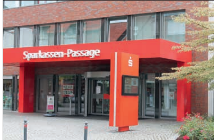
Höhere Sicherheit für Personen, Geldautomaten und Gebäude