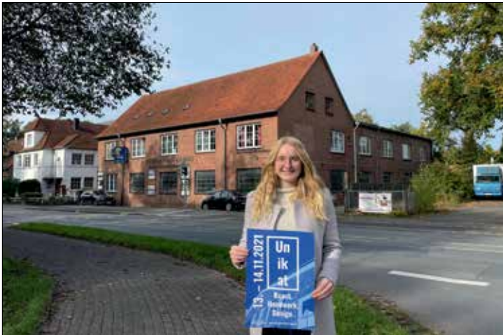
Die beliebte Veranstaltung in der Alten Lederfabrik lädt am 13. und 14. November zum Entdecken und Verweilen ein

Am 13. und 14. November können sich Liebhaber von Kunst, Handwerk und Design wieder auf die UNIKAT in der Alten Lederfabrik freuen. Neben den Gastaussteller*innen öffnen die Kunstschaffenden ihre Ateliers und Werkstätten in dem alten Fabrikgebäude. Es wird eine Vielfalt aus u.a. Holz, Keramik, Glas, Filz