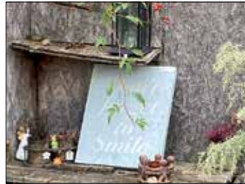
...netten Ansichten ...

trockenem Wetter diesmal von der Kreissparkasse aus, wo ein Plan