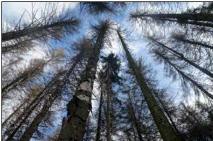
Die Natur und Wildnisschule wünscht sich einen Stufenwald mit einem Strauchgürtel anstatt Fichten-Monokultur am Teutoburger Wald

Seit mittlerweile 20 Jahren ist die Natur- und Wildnisschule im Teutoburger Wald in Halle (Westf.) beheimatet. Als Bildungseinrichtung im Bereich der Umweltverbindung unterstützen sie mit ihrem Kurs- und Weiterbildungsangeboten Menschen dabei, ihre Beziehung zur Natur zu stärken und vertiefen. Essentiell für ihre Arbeit ist dabei der 5 Hektar große „Schulwald“, der in ökologisch besonderer Lage direkt an das Wildniscamp angrenzt.