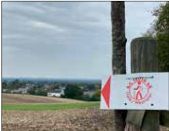
...ging es immer den gut sichtbaren Hinweisschildern nach ....

Storck nach dem coronabedingten Ausfall im letzten Jahr wieder