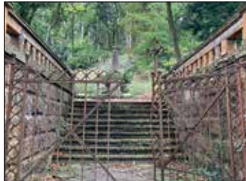
... mit schönen Ein -

schilderten, unterschiedlich langen Strecken rund um den Teutoburger Wald. 147 Wanderer folgten Anfang Oktober diesen Jahres der Einladung und starteten bei noch