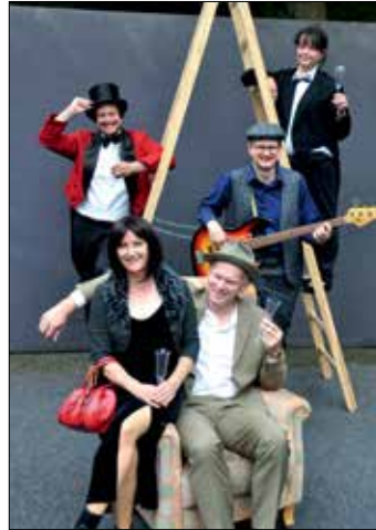
-Wiederaufnahme der Kriminalkomödie „Die 39 Stufen“-

In einer Wiederaufnahme der Kriminalkomödie „Die 39 Stufen“ vom Sommer 2021 kommt es in der winterlichen Zeit im Theater Melle, Schürenkamp 14 zu diesem komö-