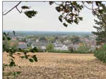
... und schönen Ausblicken...

schilderten, unterschiedlich langen Strecken rund um den Teutoburger Wald. 147 Wanderer folgten Anfang Oktober diesen Jahres der Einladung und starteten bei noch