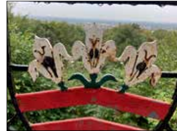
...und Aussichten ...

eine gut geröstete Bratwurst anbot, ob zur Stärkung für zwischendurch oder fast am Ende der Wanderung, je nach weiterer Wanderlust. Leider glänzte der Sonntagvormittag mit