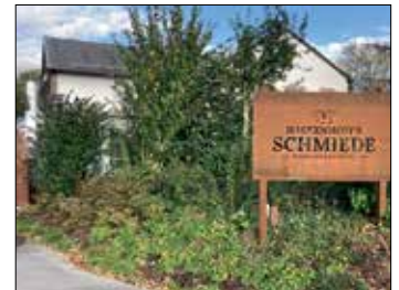
Erste Hingucker weisen auf die neue Bestimmung hin

rasse unter dem Motto „Entspannt und ungestört feiern“ für die ersten Feierlichkeiten bis zu insgesamt 200 Personen zur Verfügung – entweder komplett oder aber gern auch nur einzelne Bereiche. Das geschmackvolle Raumkonzept ist auf alle Möglichkeiten ausgerichtet. Geschmackvoll ist auch das kulinarische Angebot aus dem Hause Haskenhoff. Ob Barbecue, Buffet oder Menü, ein Hochzeit-Special oder Saisonales – die Speisemöglichkeiten lassen sicher keine kulinarischen Wünsche offen und können individuell für den jeweiligen Anlass mit Werner Haskenhoff und