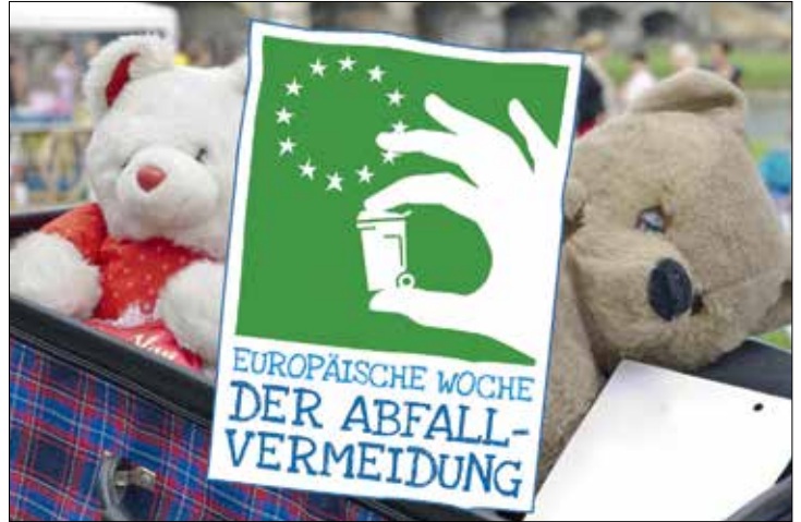
Wegwerfen war gestern: Die ash kommt am 20. November zum Entsorgungspunkt Nord

Die nächste „Europäische Woche der Abfallvermeidung“ steht an. Das nehmen GEG und ash Gütersloh zum Anlass, einen weiteren Wiederverwendungstag auf dem Entsorgungspunkt Nord, Im Hagen 1a, anzubieten. Alten, aber gut erhaltenen Schätzchen, soll ein zweites Leben gegeben werden. Die Aktion findet am Samstag, 20. November statt, natürlich unter Einhaltung der geltenden Hygienevorschriften zum Schutz vor dem Coronavirus.