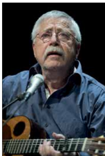
Wolf Biermann am 6. Nov. im KGH

Wolf Biermann kommt am 6. November um 19.30 Uhr nach Halle. In der Aula des KGH wird der Liedermacher und Dichter dort unter dem Titel „Mensch Gott!“ eine Lesung und Lieder präsentieren. Wolf Biermann - die meisten verbinden mit dem Namen einen aufsässigen