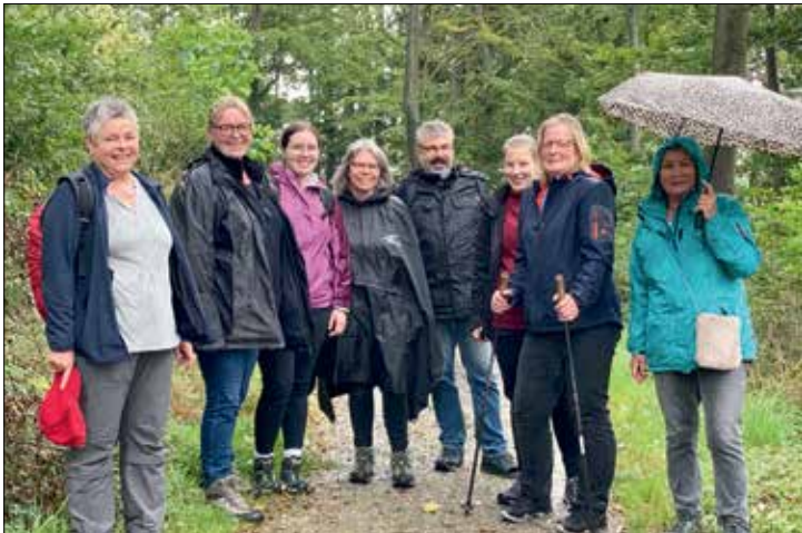
Mit Hut und Stock und Regenschirm und bester Laune ...

Das waren neben einer Wegzeherung die wichtigsten Utensilien für den