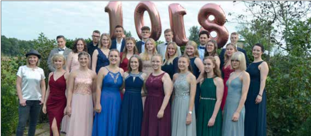
27 Schüler der Eva Hüser Schule haben im September ihre schriftlichen, praktischen und mündlichen Prüfungen für das Staatsexamen abgelegt.

Es war eine dreijährige Ausbildungszeit voller Hürden und Herausforderungen – doch es hat sich gelohnt! Mit viel Flexibilität und Willensstärke haben 27 Schüler der Eva Hüser Schule im September ihre schriftlichen, praktischen und mündlichen Prüfungen für das Staatsexamen abgelegt. Mit der feierlichen Übergabe der Urkunden durch den Prüfungsvorsitzenden der RLSB am 25. September wurden sie offiziell dazu befähigt, die Berufsbezeichnung Physiotherapeut zu tragen und konnten bereits im Oktober motiviert in den Arbeitsalltag starten. Wir gratulieren allen Absolventen noch einmal herzlich und wünschen einen guten Start in das Berufsleben! Schön, dass ihr bei uns ward! Direkt im Anschluss an