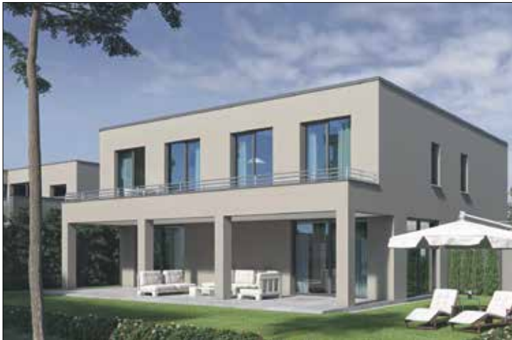
Nur noch ein Grundstück mit 586 m 2 am Haller Postweg in einer ruhigen, kinderfreundlichen Sackgasse frei

„Inzwischen ist nur noch ein Grundstück am Haller Postweg verfügbar“, betont Josef Reinhart, Inhaber der Firma Urbania Baulandentwicklungsgesellschaft. Das letzte freie Grundstück ist 586 m 2 groß und bereits erschlossen. Es liegt in einer ruhigen, kinderfreundlichen Sackgasse einer beschaulichen Siedlung. Die Nachbarbebauung besteht teils aus älteren, teils aus neueren, hochwertigen Bauten. Es ist geeignet für einen Bungalow oder für ein Ein-, ein Zweifamilien- oder ein Doppelhaus. Keller sowie Carport/Garage sind optional möglich. Der Erwerb erfolgt provisi-