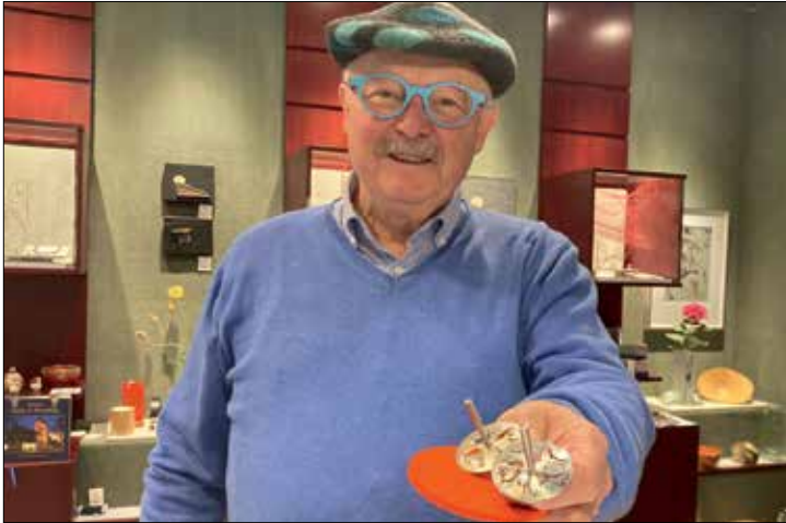
Mit dem HallerWillem, der Kaffeemühle, der Kirche, den Häusern und dem Haller Herz ist der Haller Kreisel ein wunderbares, einzigartiges Zeugnis für Halle