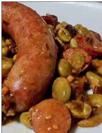
Zutaten für 2 Personen