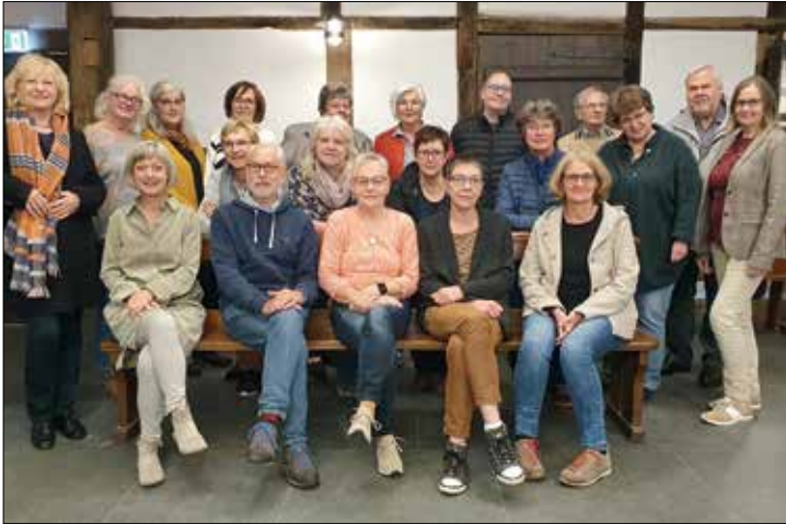
Alle Ehrenamtlichen und Fachberaterinnen für die Besuchsdienste ältere Menschen im Kreis Gütersloh

„Wir haben den Besuchsdienst auf Distanz aufrecht erhalten“ berichtete eine ehrenamtliche Mitarbeiterin beim jüngsten kreisweite Treffen der Ehrenamtlichen der Besuchsdienste für ältere Menschen. Davon konnten auch die anderen Teilnehmer berichten, denn die ehrenamtlichen Mitarbeiter haben ihre Besuchspartner auch während der Corona Pandemie weiter begleitet. Die wöchentlichen Besuche wurden verändert. Im Logdown wurden Wohlfühlrufe getätigt, dann durften die Besuche auch draußen stattfinden, Besuche mit Abstand oder Spaziergänge wurden unternommen. Die Ehrenamtlichen waren sehr flexibel und einfallsreich. Der Besuchsdienst für ältere Menschen ist ein verbandsübergreifendes Begegnungsangebot. Die kreisangehörigen Wohlfahrtsverbände AWO Kreisverband, Caritasverband für den Kreis Gütersloh e.V., Diakonie Gütersloh e.V. und DRK Kreisverband Gütersloh kooperieren mit den Kommunen vor Ort und ermöglichen so eine ortsnahe und verlässliche Begleitung der älteren Menschen. Im Auftrag der AG der Freien Wohlfahrtsverbände im Kreis Gütersloh übernimmt organisiert die Fachberatung für Senioren- und Ehrenamtsarbeit der Arbeitsgemeinschaft neben