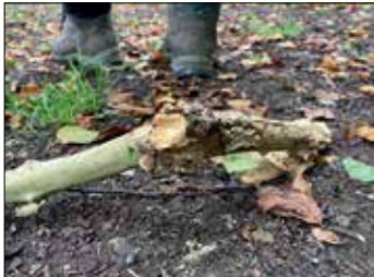
... über Stock ...

eingeladen hatte. Traditionell am 3. Oktober schnüren dann viele Wanderfreunde nicht nur aus Halle ihre Wanderschuhe und begeben sich auf die immer bestens ausge-