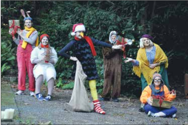
Wintermärchen der Waldbühne Melle zum ersten Mal im Freien