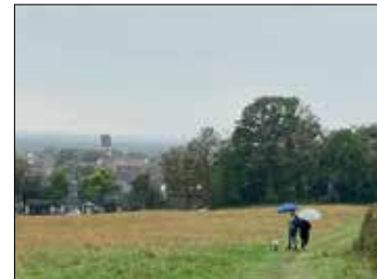
...über den Schützenberg zurück

zum Teil lang anhaltenden Regenschauern, die die Freude an der Wanderung doch ein wenig trübten und sicherlich zahlreiche Wanderleute bereits nach dem ersten Teil aufs heimische Sofa trieb. Aber so