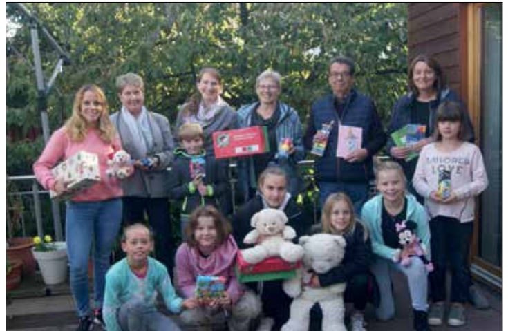
Ein Teil des WiS Helfer-Teams, zuständig für Werther, Halle, Borgholzhausen und Steinhagen

Es geht wieder los mit der Aktion „Weihnachten im Schuhkarton“! Die Aktion wird auch dieses Jahr wieder in bewährter Form stattfinden. Die fertig gepackten Kartons können also, wie gewohnt, bereits ab Mitte Oktober abgegeben werden. Letzter Termin ist in diesem Jahr der 15. November. Für uns als Team ist es jedoch hilfreicher, wenn die Päckchen möglichst frühzeitig abgegeben werden, damit das Aufkommen leichter zu bewältigen ist.