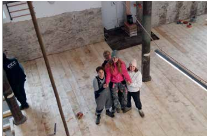
Hilfseinsatz der evangelischen Kirchengemeinde in Unterburg (Wermelskirchen) vom 10.10.-16.10.2021

Am 14. Und 15. Juli 2021 stieg der Wasserstand der Wupper innerhalb von 24 Stunden um mehr als vier Meter an. Die Folge: eine unvorstellbare Verwüstung. Unzählige Häuser wurden überschwemmt und Wohnungseinrichtungen vollständig zerstört. Es entstand ein gewaltiger materieller und auch seelischer Schaden.