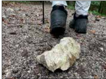
... und über Stein ....

diesjährigen Volkswandertag, zu dem der RC Teuto gemeinsam mit der Kreissparkasse und der Firma