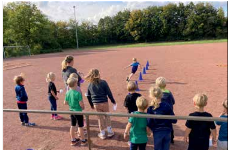
Lange Schlange beim Koordinations Slalomlauf mit rund 60 Kindern aus Künsebeck

Die Nachmittagssonne strahlte über die rote Asche auf dem Künsebecker Sportplatz. In der Zeit von 15:30 Uhr bis 17 Uhr konnten alle Künsker Groß und Klein auf den heimischen Sportplatz kommen um das olympische Gefühl zu spüren. So flatterten am Einlass schon die 5 farbigen Ringe in Form einer großen Flagge und machten Lust auf Sport. Der in die Jahre gekommene Sportplatz hatte sich dank vieler Ehrenamtlicher in das Olympia Stadion „Akpinasus“