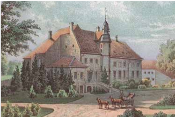
Schloss Steinhausen war ein herrschaftliches Rittergut mit Park, Gartenanlagen und vielen Ländereien - vergleichbar u.a. mit Schloss Königsbrück