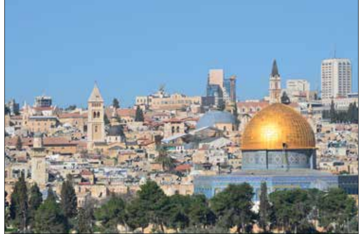
Wie schön ist die Vorstellung, am 31. Oktober den Reformationstag am See Genezareth zu feiern!