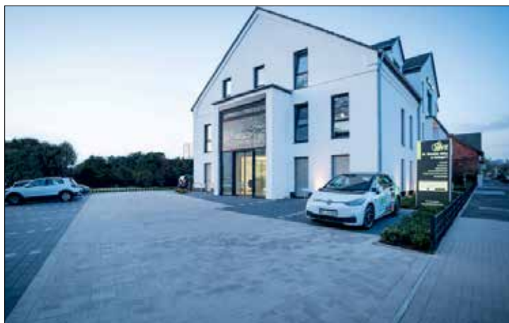
Das neue Gebäude bietet mit 500 m 2 eine großzügige Praxisaufteilung