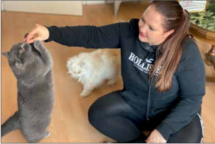
In ihrer Bielefelder Wohnung leben neben ihrem Freund außerdem die Perserkatze ‚Uschi‘, die Fundkatze ‚Glotzi‘, die mit der Flasche aufgezogene ‚Ninja‘ und die etwas schüchternere ‚Polly‘