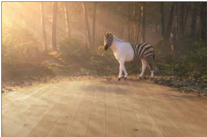
Das Baufachzentrum Nilsson präsentiert den Fußboden der Zukunft: HYWOOD des Herstellers ter Hürne

Warum wünschen sich Konsumenten einen Holzboden, treffen aber am Ende eine andere Kaufentscheidung? Diese Frage lässt sich mit dem neuen Bodenbelag „Hywood“, dem Echtholz-Hybridboden beantworten. Viele Menschen haben erkannt, dass die Zeit reif ist für Veränderungen. Dabei spielt der Werkstoff Holz eine entscheidende Rolle. Mehr denn je wird das Augenmerk der Verbraucher auf das Thema Nachhaltigkeit, Ressourcenverfügbarkeit und auf Umweltbewusstsein gelegt. Ein