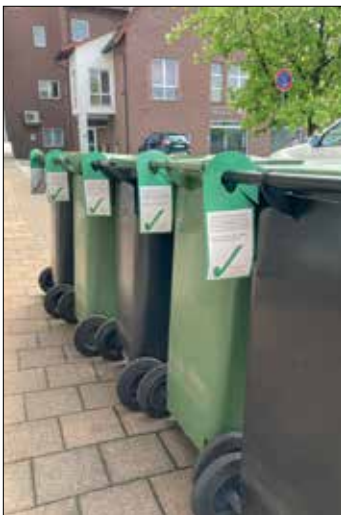
Fünfmal Grün in Reihe: ein Anblick, über den sich die Verantwortlichen der Aktion freuen

diesem Tag eine Spülbürste, eine Reispackung und ein Tetrapack zu Tage förderte. Anschließend versehen sie die Tonnen entsprechend des Inhalts mit einem Roten, Gelben oder einem Grünen Anhänger, die jeweils entsprechende Informationen für die Eigentümer der Biotonne tragen. Sie dienen gleichzei-