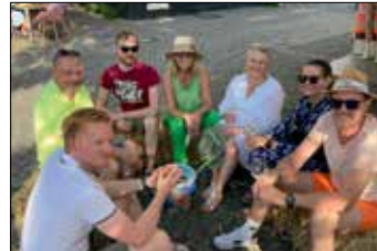
Strohballenkreis – mit den Quadem konnte man es sich gemütlich machen