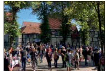
Auch der Herbst-Flohmarkt am Samstag war ein buchstäblich voller Erfolg

die Besucher auch gern im Sonnenschein gemütlich machten. In der gesamten Innenstadt luden außerdem die vielen Strohballen ein, darauf Platz zu nehmen, Kuchen und Crêpes zu genießen oder der Stra-