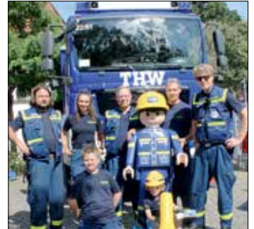
... wer später ein THWler werden möchte

vor seiner Staffelei Platz nahmen. Von dort aus hatte man wunderbar Clown Theo im Blick, der mit großen