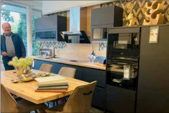
Die schicke Küchenfront gibt es neben der Farbe Schwarz zudem in Weiß, Creme, Rot, Grün und Blau und kann auch mit Griffen bestellt werden

„Eine der besten Fronten im Küchenbereich“, erklärt Stefan Barz, Inhaber des Haller Möbelhauses Vollmer mitten im Herzen von Halle, in Hinblick auf das neueste Trendthema „Easy Touch“ für eine neue Küche. Durch einen leichten Perleffekt ist die Oberfläche supermatt und somit fast ohne Griffspuren – egal ob klassisch in Alpinweiß, Weiß oder Sand, in moderner Optik in Fjordblau, Mineralgrün, Rostrot oder Grafit schwarz oder auch eine Kombinationen daraus – die Nobilia-Highlights im Küchenbereich sind vielfältig und sehr schick. „Natürlich sind auch hochglänzende Fronten im Angebot – also für jeden etwas“, betont Stefan Barz. Außerdem sind die Fronten sowohl grifflos als auch mit Griff lieferbar. „Im gesamten Küchenbereich wird