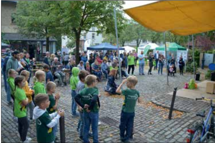
Buntes Programm und jede Menge Informationen locken zahlreiche Besucher*innen zum Bürgerzentrum Remise

Nach zwei Jahren Corona-Pause fand am 11. September wieder der Haller Umweltmarkt statt. Es wurde viel geboten – insbesondere auch für Kinder. Auch in diesem Jahr wurde zusammen mit Schulen, Vereinen und anderen Initiativen wieder ein vielseitiges Programm erstellt, das Informationen und Unterhaltung für die ganze Familie versprach. Die Besucher*innen konnten sich an 27 Ständen über Themen wie klimafreundliche Mobilität, nachhaltige Kleidung und naturnahe Gartengestaltung informieren. Zahlreiche Aussteller*innen aus Halle und Umgebung boten ihre Produkte an. Doch nicht nur Informationen konnten die großen und kleinen Besucher*innen an den Ständen erhalten, es gab auch