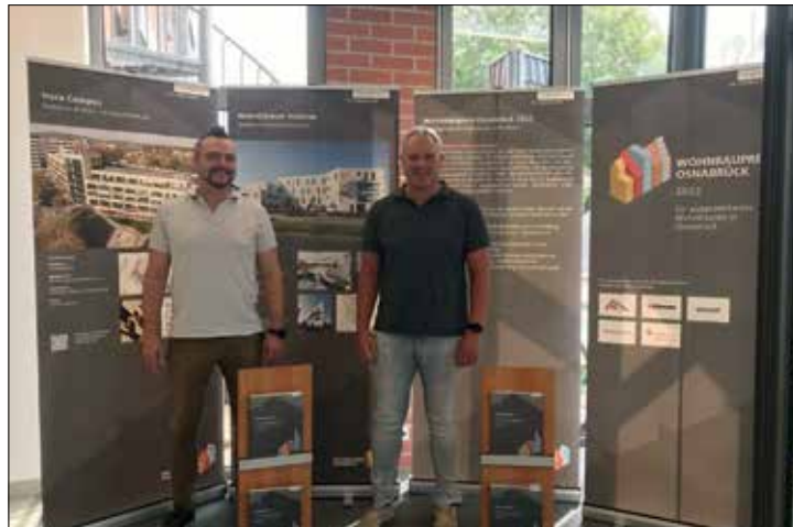
Das Baufachzentrum Nilsson präsentiert als einer der fünf Sponsoren die Ausstellung des 1. „Wohnbaupreis Osnabrück“ 2022 in der eigenen Ausstellung in OS-Lüstringen

Ab dem 29. August 2022 stellt das Baufachzentrum Nilsson als einer der fünf Sponsoren des durch die Stadt Osnabrück ausgelobten „Wohnbaupreis Osnabrück“ die eingereichten Projekte der Teilnehmer und Teilnehmerinnen in der eigenen Ausstellung am Heideweg 8-16 in Osnabrück-Lüstringen aus. Ca. 20 eingereichte Bauprojekte aus dem Raum Osnabrück in fünf verschiedenen Kategorien werden in einer bildlichen Ausstellung jeweils kurz vorgestellt. Die Kategorien unterscheiden sich in: Einfamilienhaus, privates Eigenheim, Mehrfamilienhaus/Geschosswohnungsbau, Quartiersentwicklung/moderner, Siedlungsbau, Sonderwohnformen, Bauen im Bestand. Voraussetzung der Teilnahme war, dass die Bauten nach dem 01. Januar 2016 und spätestens zum Zeitpunkt der Einreichung im Stadtgebiet Osnabrück fertig gestellt sein müssen. Je Kategorie wurde durch eine Jury bestehend aus Fach- und Sachjurorinnen und -juroren ein Preisträger bzw. eine Preisträgerin ermittelt. Der Ehrenpreis wurde am 26.03.2022 in der OsnabrückHalle verliehen. Mit der Auslobung des Wohnbaupreis Osnabrück sollen Bauverantwortliche realisierter Projekte der letzten fünf Jahre für ihr Engagement und ihre Vorbildfunktion ausgezeichnet werden. Eindrucksvolle und vielfältige Bauten tragen zur Identität und Standortattraktivität bei und somit auch zur Steigerung der Lebensqualität der Osnabrücker und