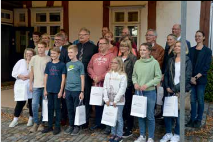
Sieger*innen im Rahmen des Haller Umweltmarktes durch Bürgermeister Thomas Tappe ausgezeichnet