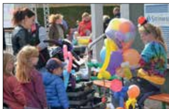
Anstehen heißt es für die Kleinen, um eine der begehrten Figuren von der Ballonkünstlerin zu erhalten

hatten sich von Beginn an viele Menschen versammelt. Dass zeige doch, wie gut die Hesselner feiern können, denn anderswo halte man