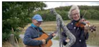
Kunst und Kultur auf der Drachenwiese zur RadKulTour– mit ‚Saitenwirbel‘ bei Seitenwind

de zu einem gemütlichen Garten – mit grünem Rasen, Pflanzen und Sitzgelegenheiten für nette Begegnungen. „Park statt Parken“ lautete die Aktion. Am 23. September fand die letzte Aktion zu den Mobilitätstagen statt. Wer an dem Donnerstag nicht mit dem Auto unterwegs war, hatte die Möglichkeit einen Halle-Gutschein zu ergattern. An drei Standorten des Rathauses mit Publikumsverkehr, wurden diese an alle Personen, die an dem Tag mit öffentlichen Verkehrsmitteln, dem Fahrrad oder zu Fuß gekommen waren, verteilt. –sig-