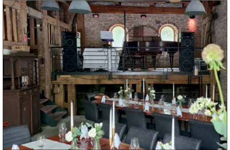
... kann man in bezauberndem Ambiente Kulturelles und Kulinarisches genießen ....

250 Quadratmeter gastronomischen Bereichs, die über 80 Gästen einen gemütlichen Platz bieten, sind auf mehreren Ebenen aufgeteilt und werden von zwei großen Terrassen ergänzt - mit Blick ins Grüne und auf den Schwarzbach. Hier kann man