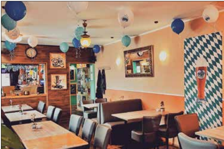
In den nächsten Wochen geht es auch in der Taverne in Halle ziemlich zünftig zu – mit Oktoberfest-Bier und bayerischen Spezialitäten

Herbstzeit ist Oktoberfest-Zeit. Auch die Taverne kleidet sich Blau-Weiß und bietet den Gästen in zünftigem Ambiente bis zum 23. Oktober leckere bayerische Spezialitäten. Zu einem frisch gezapften Oktoberfest-Bier kann man innerhalb der blau-weißen Wochen Schweinshaxen, Schweinebraten, Brezeln, Weißwürste, Leberkäse sowie Leberkäs-Auflauf und Leberkäs-Burger genießen. Auch eine bayerische Taverne-Pizza wird das Speisenangebot in dieser Zeit bereichern. Wer möchte, kann natürlich gern in Lederhosen und Dirndl kommen, um in der Langen Straße 18 einen richtig bayerischen Abend zu verbringen. Die Taverne hat immer täglich ab 17 Uhr für die Gäste geöffnet, passt die Öffnungszeiten aber auch Veranstaltungen z.B. in der OWL-Arena an. „Dann öffnen wir etwas früher, damit die Leute hier noch vorher essen können“, erklären die Inhaber Thisa Vijay und Theepan Thiru. Die aktuellen Zeiten sind immer auf der Internetseite zu finden unter www.taverne-halle.de . Am 9. Oktober bieten die beiden Gastronomen außerdem wieder einen Sonntags-Brunch. Ab 10