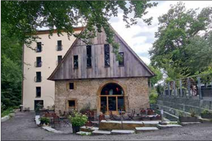
In der Wassermühle Deppendorf ...