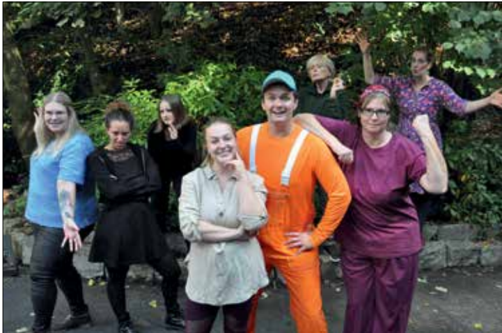
„Drache Kokosnuss“ und „Die Welle“ im Winterprogramm