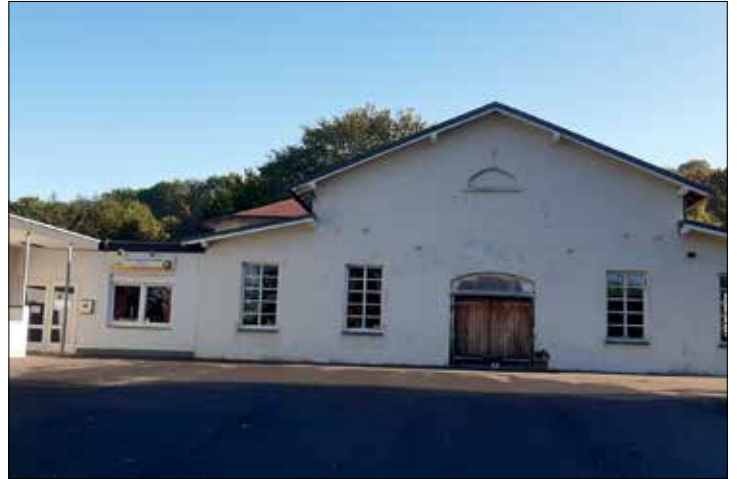
Der Schützenberg als Heimat für die Haller Schützen ist ab dem nächsten Jahr Geschichte – eine über 100jährige Geschichte