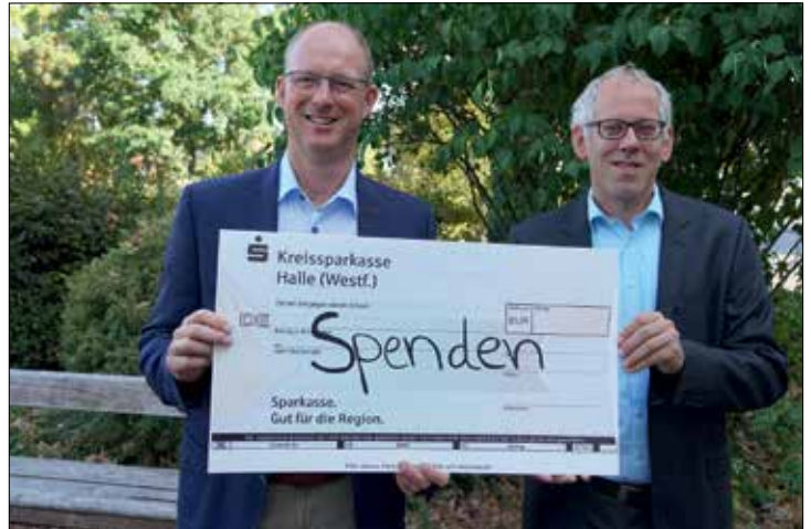
Bürgermeister Thomas Tappe und Kämmerer Björn Hüllbrock

Die Spendenaufrufe zu Gunsten der Flutopfer in Bad Münstereifel und zur Unterstützung der geflüchteten Menschen aus der Ukraine haben gezeigt, dass die Spendenbereitschaft in Halle groß ist. Die Stadtverwaltung hat darauf reagiert und ein Spendenformular auf der städtischen Internetseite eingerichtet. „Der Wunsch wurde aus der Bevölkerung an mich herangetragen, dass es eine Möglichkeit geben sollte, sinnvolle Projekte auf unkompliziertem Wege unterstützen zu können“, erläutert Bürgermeister Thomas Tappe. Mit dem neuen Online-Formular soll das Spenden zukünftig einfacher werden. Spenden können über verschiedene