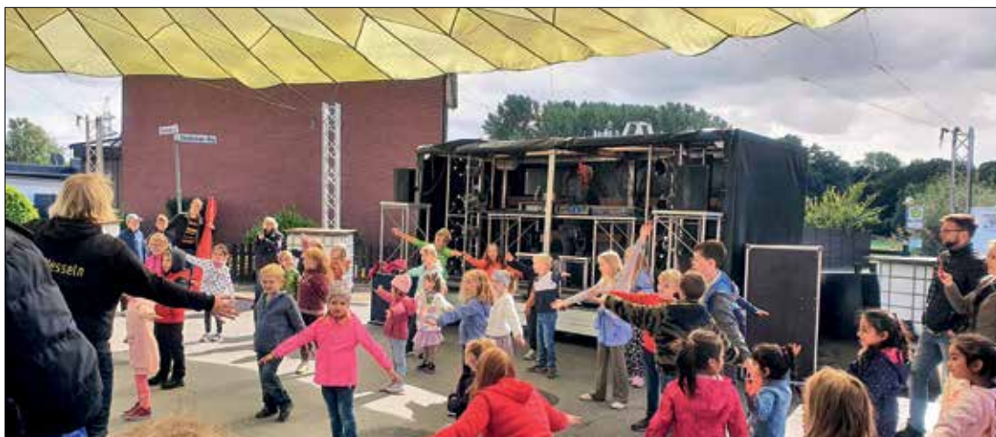
Kinder aus ganz Hesseln führten mit viel Spaß ihre einstudierten Tänze auf

Ein Jubiläum, das man bereits vor zwei Jahren geplant hatte und nun feiern konnte: beim 10. Dorfgemeinschaftsfest des Haller Orts- teils Hesseln merkte man allen Mit- wirkenden und Besuchern an, wie sehr sie sich nach der langen Pause darauf gefreut hatten. Das 9-köpfi- ge Organisationsteam - insbeson- dere vom Förderverein der AWO Kita Hesseln und vom Sportverein SG Hesseln - hatte sich einiges für Jung und Alt einfallen lassen. Unter dem 18 Meter großen Schirm, der bereits zur Tradition geworden ist, sowie vor und im Hesselner Treff