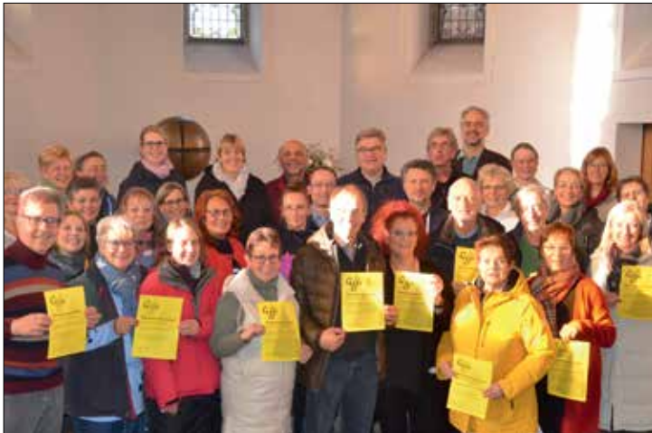
Der Haller Gospelchor GAM probt bereits fleißig für sein bevorstehendes Weihnachtskonzert

Die neue Konzertreihe des Haller Gospelchores GAM beginnt weihnachtlich. GAM bittet Gäste, Freunde und Verwandte zum ebenso besinnlichen wie schwungvollen Weihnachtskonzert Samstag, 10. Dezember um 18 Uhr in die katholischen Herz-Jesu-Kirche in Halle. Dafür haben die Chormitglieder schon seit September fleißig Weihnachtslieder geprobt - und das bei wenig winterlichen Temperaturen. Am vergangenen Samstag wurde mit einem Probenstag der Endspurt eingeläutet. Alle Stücke wurden noch einmal kräftig geübt, so dass in den nächsten Wochen bis zum Konzert nur noch der Feinschliff nötig ist. Geplant ist ein gut einstündiges Programm unter der Leitung von Mi-