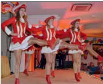
Die Tanzmariechen ....

Wer hier oben im hohen Norden des Kreises Gütersloh ob karnevalistischer Aktivitäten die Stirn runzelt, der hat noch nicht mit den Künsebecker Karnevalisten gefeiert! Die verstehen es nämlich hervorragend, auch Karnevalsmuffel zu begeis-