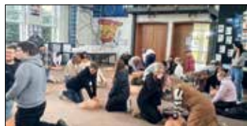
In der Aula des Berufskollegs: Schüler/innen werden in lebensrettenden Maßnahmen an Übungsphantomen geschult

wurden an die 400 Schüler/innen in einem Pilotprojekt an diesem Tag für das Thema Wiederbelebung sensibilisiert, indem sie u. a. an 25 Übungsphantomen die Anwendung „Prüfen – Rufen – Drücken“ erlernten, mit der die Überlebenschance von Betroffenen deutlich erhöht werden könnte. Vorausgegangen war ein themenbezogener Vortrag von Rico Dumcke. Der Doktorand und