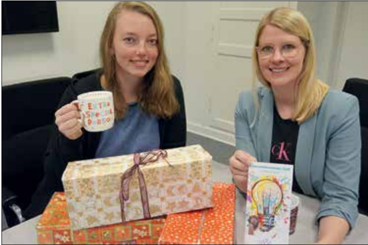
Gleichstellungsstellen Halle und Werther laden zum Jahresabschluss ein

In gemütlicher Atmosphäre trifft sich der Unternehmerinnen-Treff am Donnerstag, den 1. Dezember zwischen 18.30 und 20.00 Uhr im Bürgerzentrum Remise, Kiskerstr. 2 in Halle (Westf.). Die Organisatorinnen möchten gemeinsam mit den Unternehmerinnen das Jahr 2022 Revue passieren lassen und gleichzeitig einen Blick auf die Themen des neuen Jahres werfen. Im sogenannten „World-Café“ können sich die Teilnehmerinnen zu verschiedenen Schwerpunkten austauschen, sich Expertinnenwissen aus den eigenen Reihen einholen, beste-