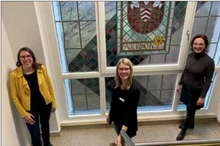
Die Gleichstellungsstelle Halle (Westf.) und die pro Wirtschaft im Kreis Gütersloh laden zum Workshop ein

Müssen wir immer schneller rennen, um alles erledigen zu können, oder geht es auch anders? Was ist wirklich wichtig im Arbeitsalltag und was ist das eigentliche Ziel? Wie teile ich meine Zeit sinnvoll ein? Diese und andere Fragen sollen im Mittelpunkt des Workshops „Zeit- und Selbstmanagement“ stehen. Das Karrierenetzwerk für Frauen in Fach- und Führungspositionen lädt am 20. Dezember 2022 zwischen 18.30 und 20.00 Uhr zu diesem