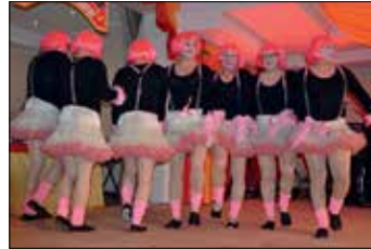
...und das Männerballet sind 2023 wieder dabei

Show soll der Brüller sein“, weiß Harald Gericke. Zum Abschluss des Abends tritt außerdem die „Kölsche Coverband“ aus Warendorf mit einem großen Repertoire an Karnevalshits auf. Da ist ein langer, fröhlicher Tanzabend garantiert. Wenn