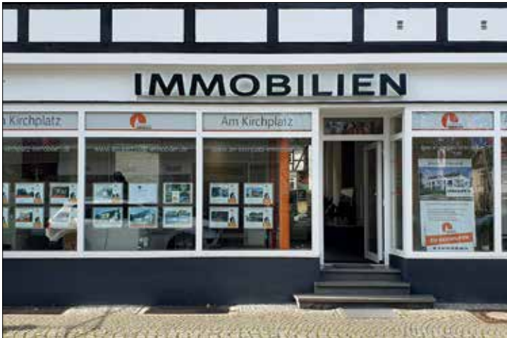
„Am Kirchplatz Immobilien“ ist bereits seit 17 Jahren in der Region in Sachen Immobilien-Vermarktung tätig und seit 2015 auch in Halle am Kirchplatz ansässig