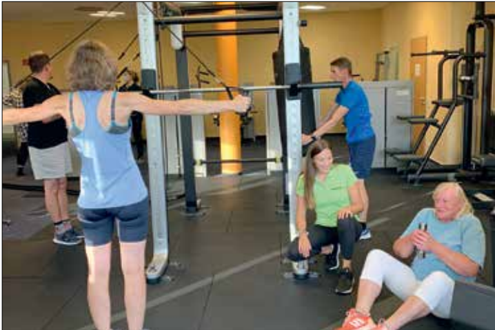
Gemeinsam macht das Training mehr Spaß! Hier werden die TeilnehmerInnen im sogenannten „Omnia-Kurs“ gegenseitig und vom Trainer motiviert.

Wussten Sie: Wer täglich nur 20 kcal mehr zu sich nimmt, würde in 5 Jahren ca. 5 kg an Gewicht zunehmen. Bei 40 kcal mehr am Tag wären es schon 10 kg nach 5 Jahren! Anders gesagt: Ausnahmen haben genauso wie kurzfristige „Blitz-Diäten“ gar nicht so große Auswirkungen auf unser Gewicht. Viel entscheidender sind unsere täglichen Ernährungs- und Bewegungsgewohnheiten. Häufig wird bei Diäten hauptsächlich die Kalorienzufuhr reduziert, was dazu führt, dass der Körper in den „Energiesparmodus“ schaltet. Ohne das richtige Training baut der Körper dann erst einmal Muskulatur ab, denn diese ist ein großer Energieverbrenner. Auf der Waage sieht das zunächst gut aus, doch in Wirklichkeit gerät der Körper in einen Teufelskreis aus Kalorienre-