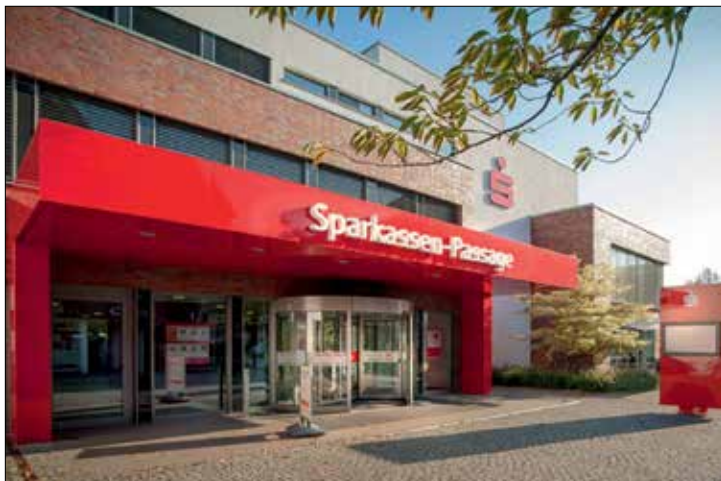
Planspiel Börse in der Jubiläumsrunde, Kreissparkasse Halle zählt bereits mehr als 180 Teilnehmende

Seit 40 Jahren ermöglicht das Planspiel Börse Schülerinnen und Schülern, Studierenden sowie Börseninteressierten einen spielerischen und praxisnahen Zugang zum Handel mit Wertpapieren. Wie in den Vorjahren beteiligt sich auch die Kreissparkasse Halle (Westf.) daran. Dort haben sich bereits mehr als 180 Teilnehmende angemeldet – Teams aus den weiterführenden Schulen in Borgholzhausen, Halle, Steinhagen und Werther, Lehr-