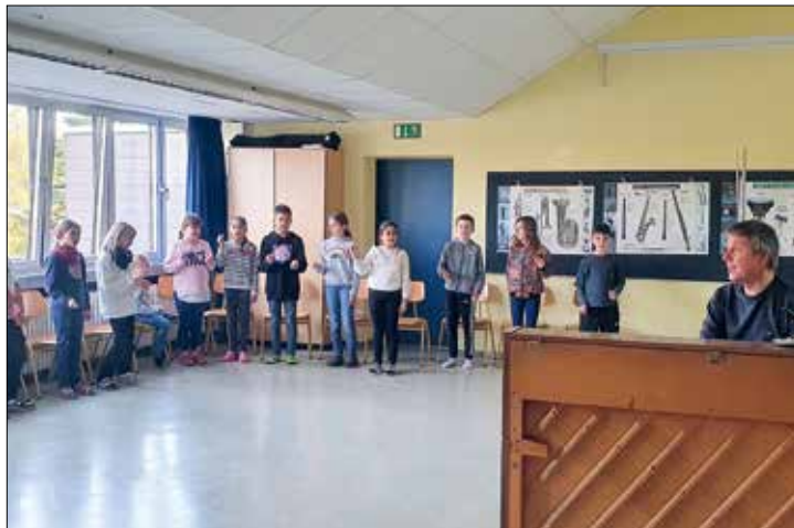
Da hält es keinen mehr auf dem Stuhl: Bei „Merry Christmas, Halleluja“ darf mit den Fingern mitgeschnipst werden