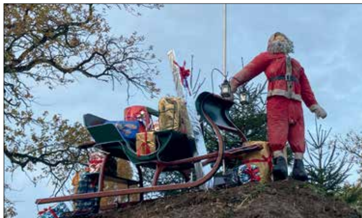
Es ist vollbracht: der Weihnachtsmann und sein Schlitten sind gelandet